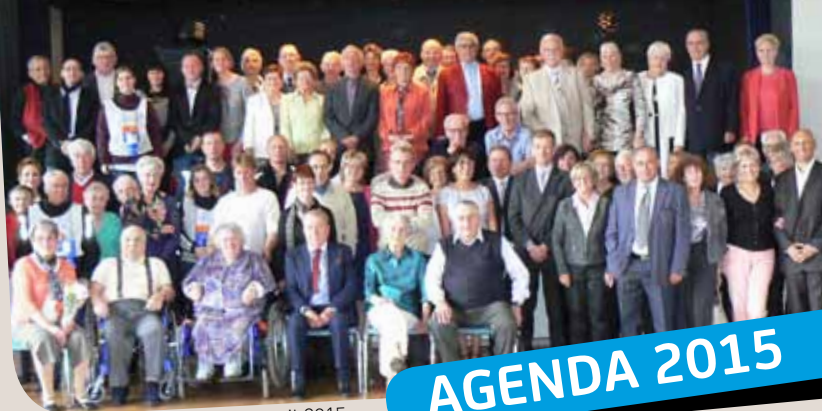
Repas des seniors en avril 2015